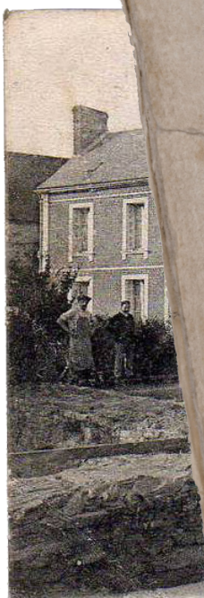
Noaille Collect. Lejeune